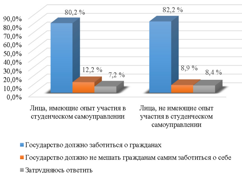
Рис. 1. Распределение ответов на вопрос «Какова, по Вашему мнению, роль государства в жизни общества?» ( n = 502 )

В результате анализа полученных данных было выяснено, что большинство опрошенных считает, что «государство должно заботиться о гражданах». Сторонники более либерального тезиса о том, что «государство должно не мешать гражданам заботиться о себе», оказались в явном меньшинстве. Это важное косвенное свидетельство сохраняющегося преобладания патерналистского мировоззрения. Характерно, что полученные результаты примерно одинаковы и у опрошенных, имеющих опыт участия в студенческом самоуправлении, и у респондентов, не имеющих данного опыта (рис. 1).